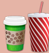
Vasos para bebidas de llevar