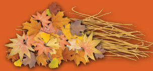
Hojas secas, paja y heno