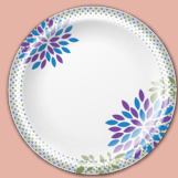
Platos de papel con coberturas brillantes