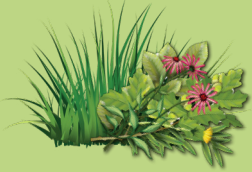
Césped y plantas