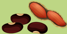
frijoles, nueces y cáscaras