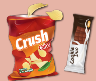
envolturas de plástico

* Se realiza el compostaje de estos artículos SOLAMENTE en los terrenos comerciales de compost, no atrás de su casa.