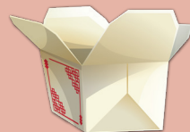
Contenedores de llevar con coberturas brillantes