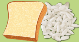
Pan y otros granos