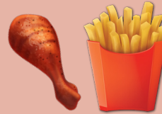
comida cocinada con grasa*