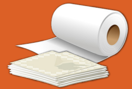
Toallas de papel y servilletas