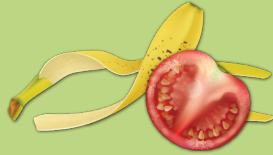
Frutas y vegetales