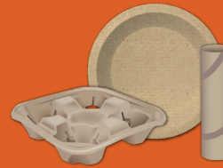
Productos de papel (sin coberturas brillantes)