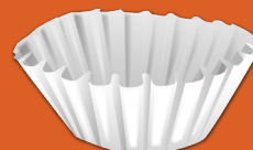
Filtros de café