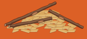
Palos rotos y astillas de madera