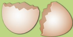
cáscaras de huevo