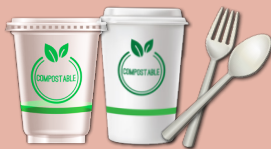
artículos de servicio certificado por BPI